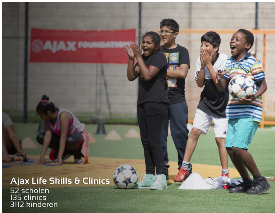
Ajax Life Skills & Clinics 52 scholen 135 clinics 3112 kinderen

De Zomerschool Zuidoost is bedoeld voor kinderen die de stap van groep 7 naar groep 8 gaan maken. Naast extra lessen in taal, begrijpend lezen en rekenen wordt gewerkt aan hun zelfvertrouwen. Kortom: drie weken lang kunnen ze het beste uit zichzelf halen zodat zij goed voorbereid aan groep 8 kunnen beginnen! De drie weken werden afgesloten met een presentatie van wat de leerlingen allemaal geleerd hadden. Uiteraard kregen de deelnemers een diploma.